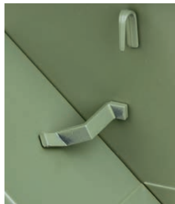
Шаг 3. В задней части установленного ранее крыла разместите кронштейн противооткатного упора. Обратите внимание: изогнутая часть кронштейна устанавливается на крыло. Совместите крепежные элементы деталей и закрепите кронштейн на прицепе.